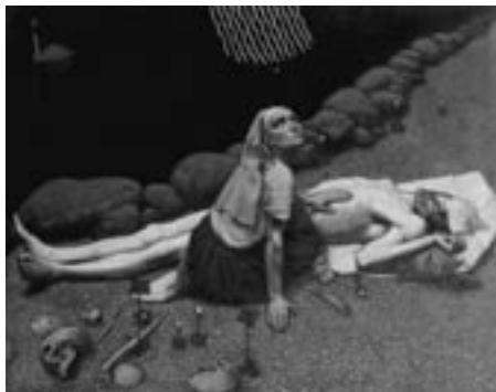
Akseli Gallen-Kallela, De moeder van Lemminkäinen, 1897

Akseli Gallen-Kallela (1865-1931) is een van de meest gezichtsbepalende kunstenaars van de zoge-