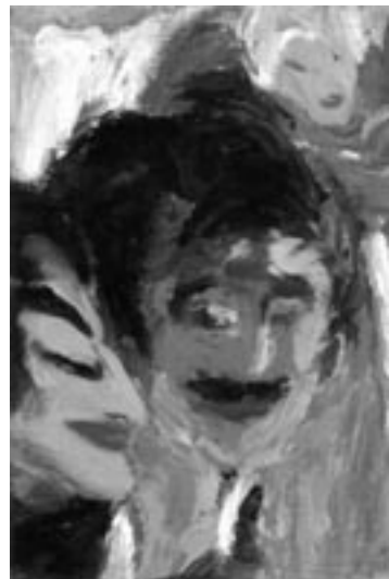
Emil Nolde, Café-gasten (detail), 1911 (Nolde Stiftung Seebüll)