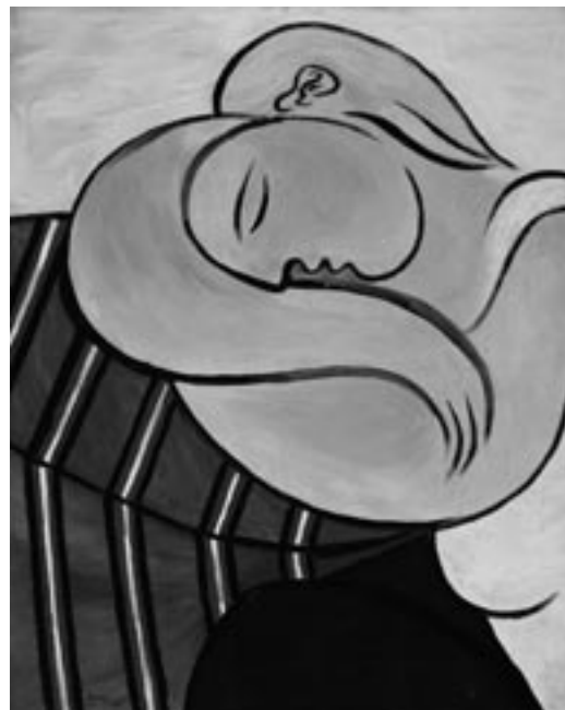
Pablo Picasso, Vrouw met geel haar, 1931