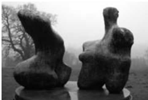
Henry Moore, Liggende figuur, 1959