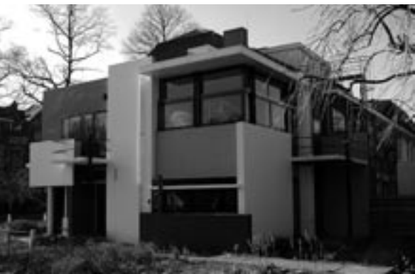
Gerrit Rietveld, Rietveld-Schröderhuis, 1924, Utrecht