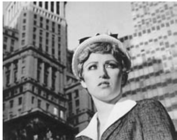
Cindy Sherman, Untitled Film Still no. 21, 1978