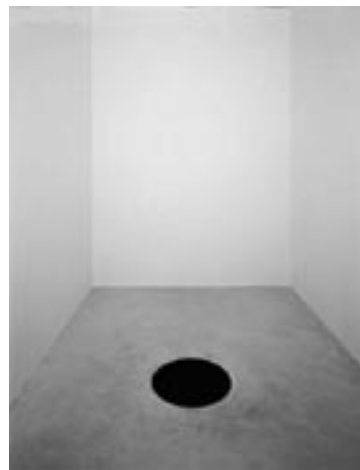
Anish Kapoor, Afdaling in het ongewisse , 1992

Corma Pol heeft een praktijk voor begeleiding van kunstenaars en is freelance kunsthistoricus. In 1985 was zij een van de oprichters van Stichting Kunst in Zicht.