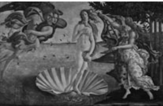
Sandro Botticelli, De geboorte van Venus, circa 1482