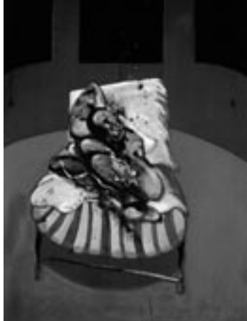
Francis Bacon, Studie voor een 'Kruisiging', 1962

De van oorsprong Ierse schilder Francis Bacon (1909-1992) heeft met zijn fascinerende verbeeldingen van de mens een geheel eigen positie in de schilderkunst van na 1945 verworven. In zijn werk is de 'condition humaine', het isolement van de mens, het leidende principe. Bacon toont ons het menselijk lichaam als een stuk aangeschoten wild: vleeshompen met menselijke trekken. Onbarmhartig illustreert hij zijn opvattingen met visioenen van krijsende gedochten in kooien, abattoirs met verminkte kadavers en geamputeerde rompen. Zijn onderwerpen werkt hij vaak uit in prachtige kleurstellingen, waarbij hij zijn figuren ten tonele voert in raadselachtige ruimtes. Zijn schilderijen maken veel los bij de toeschouwer,