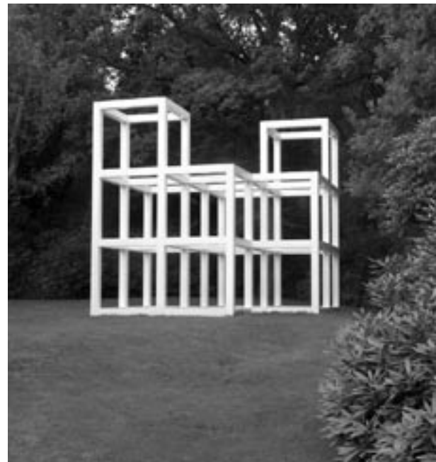
Sol LeWitt, 2 x 7 x 7, 1990 (Landgoed Clingenbosch, Wassenaar)