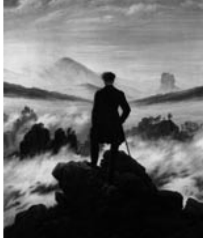
Caspar David Friedrich, Wandelaar boven de nevels, circa 1818