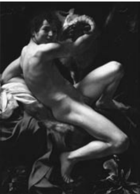
Caravaggio, Johannes de Doper, 1602

schilders een essentiële basis voor de verzameling van Guggenheim. Aangevuld met legaten kreeg de collectie een uitgesproken Europees karakter, met werken van Duchamp, Brancusi, Arp, Gris, Schwitters, Franse en Duitse Impressionisten en Post-Impressionisten. Peggy Guggenheim, een nichtje van Solomon, verzamelde duidelijk andere werken dan haar oom: zij concentreerde zich op werken uit het Surrealisme en Abstract-Expressionisme.