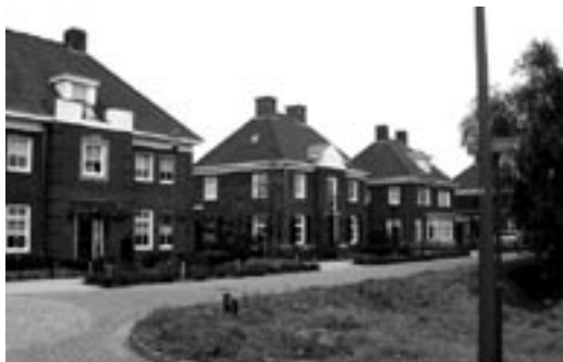
De wijk Brandevoort in Helmond

Bij het grote publiek blijkt vooral de jaren '30-architectuur het goed te doen. Een erker, een grote kap met een brede gootlijst, glas in lood, een kamer-ensuite en plafonds met ornamenten vertegenwoordigen de sfeer waar men naar op zoek is en die vaak omschreven wordt als knus en gezellig. Vanwege de populariteit worden er nieuwe woningen gebouwd