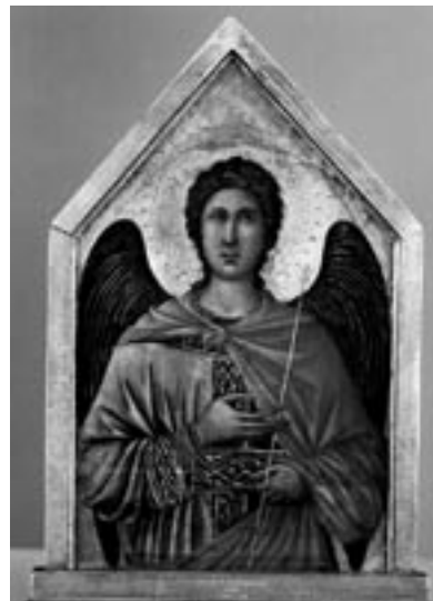
Duccio, Aartsengel Gabriël, circa 1310