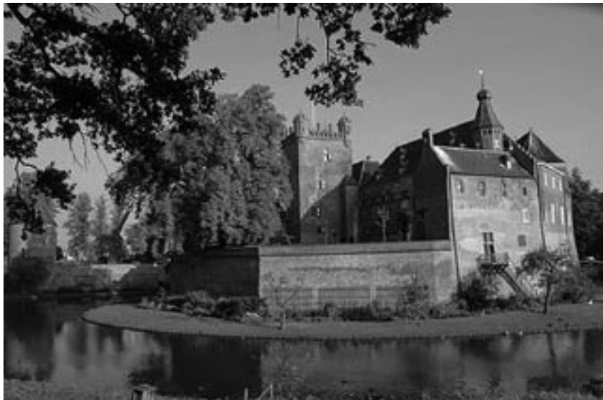
Kasteel Huis Bergh, 's-Heerenberg