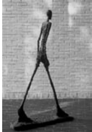
Alberto Giacometti, Lopende man , 1960