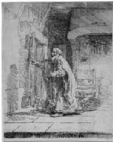
Rembrandt van Rijn, De blinde Tobias , 1651

De lezing zal zich beperken tot de verzameling van Pictura die eveneens bijna helemaal is geliquideerd, maar in grote lijnen uit de archiefstukken kan worden gereconstrueerd. Een restant van deze collectie is nog in het bezit van het genootschap en wordt door het Groninger Museum als bruikleen