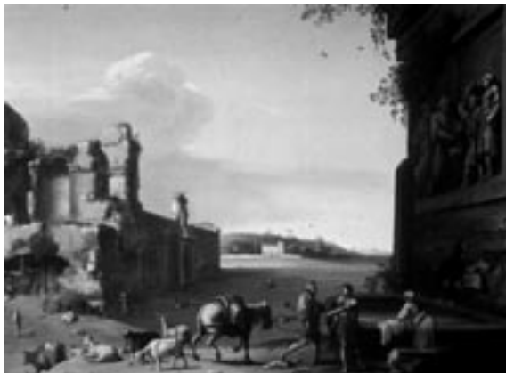
Cornelis van Poelenburgh, Ruines in Rome, circa 1620

Tijdens de meerdaagse excursie op 28-30 november brengen we een bezoek aan deze tentoonstelling. Als voorbereiding hierop volgen we het spoor van noordelijke kunstenaars die in de 16de en 17de eeuw naar Italië reisden. Een reis die niet zonder gevaren was. Op de Noordzee waren Spaanse kapers actief en op de Middellandse zee maakten zeeroovers de kust onveilig. De reis over land werd