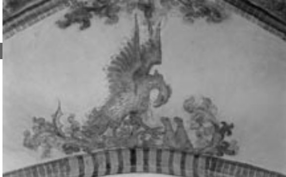
Pelikaan, gewelfschildering in het koor van de kerk in Loppersum, circa 1500

In Middelstum en Noordbroek wordt bijvoorbeeld de heilsgeschiedenis uit de doeken gedaan, van