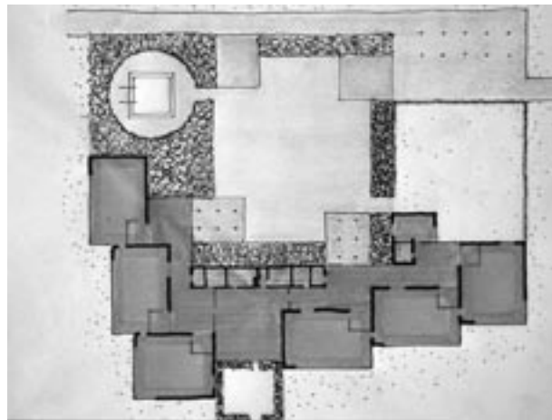
A. Van Eijck, H. Van Ginkel, Schoolgebouw, Nagele

In Nagele zijn de woningen en winkels zeer gelijkvormig uitgevoerd. De ontwerpers hadden hier twee redenen voor. In de eerste plaats streefden zij naar een gelijkwaardige menselijke samenleving. In zo'n samenleving paste een architectuur die verschillen tussen mensen zou verminderen in plaats van benadrukken. In de tweede plaats waren de ontwerpers beïnvloed door nieuwe stedenbouwkundige ideeën. Door modernisering in de architectuur, werden veel huizen gebouwd met standaardplattegronden, van prefab materialen en met platte daken. Bovendien waren architecten gefascineerd door de scheiding