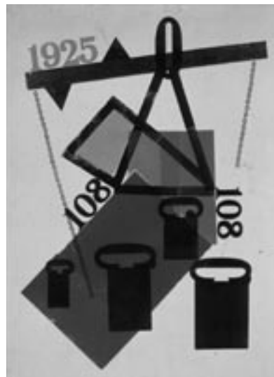
Hendrik Nicolaas Werkman, Balans, 1925

Jikke van der Spek is als kunsthistorica sinds 2005 werkzaam bij het Werkmanproject en één van de drie auteurs van H.N. Werkman, het complete oeuvre , de omvangrijke publicatie die in juni 2008 is verschenen.