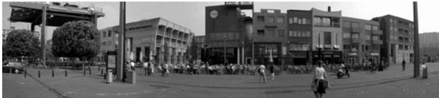
Grote Markt, Almere

We sluiten de dag af met koffie of thee in Casa Casla, Centrum voor Architectuur Stedenbouw en landschap van Almere.