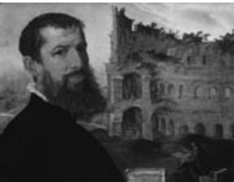
Maarten van Heemskerck, Zelfportret met Colosseum in Rome, 1553

Op weg naar Keulen doen we het Zentrum für Internationale Lichtkunst in Unna aan. Het is het eerste en enige museum ter wereld dat zich uitsluitend wijdt aan lichtkunst. Het werd in 2001 geopend in de voormalige brouwerij van Linden-Adler-Pils en maakt nu deel uit van de 'Route der Industriekultur'. We zullen ondergronds rondgeleid worden door een labyrintisch complex van gangen en kelders, langs installaties van hedendaagse kunstenaars die werken met kunstlicht. Licht dient daarin niet meer voor de interpretatie of illustratie van iets anders, maar wordt zelf een artistiek beeldend middel. Naast schilderkunst, beeldhouwkunst of fotografie is lichtkunst tegenwoordig een zelfstandige kunstvorm. Twaalf internationaal