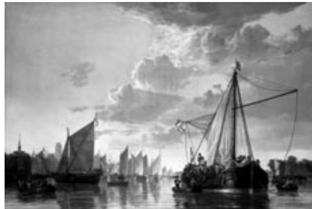
Aelbert Cuyp, Gezicht op Dordrecht, 1650