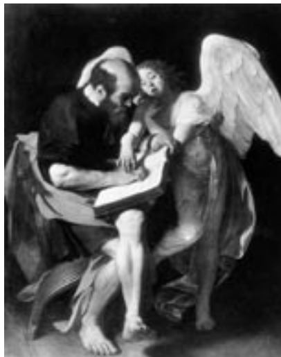
Michelangelo Merisi da Caravaggio, De heilige Mattheus en de engel , 1602 (verloren gegaan in 1945)

Dergelijke vragen zullen aan de orde komen aan de hand van een aantal 16de- en 17de-eeuwse voorstellingen van schrijvende evangelisten, met als uitgangs-