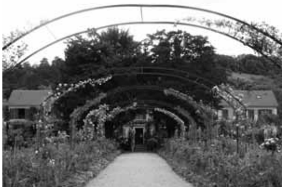
Tuin van Claude Monet in Giverny