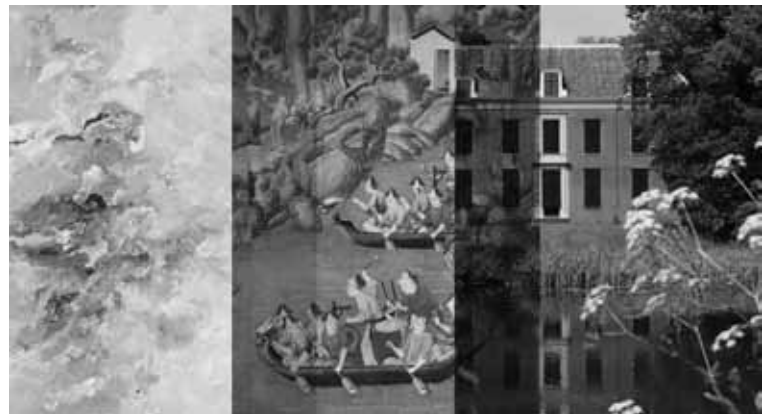
Museum Oud-Amelisweerd

Kasteel de Haar oogt als een middeleeuws sprookje met haar torens, ophaalbrug en weergangen. Maar achter deze indrukwekkende hoge muren schuilt de wereld van weelde en luxe waarin de familie Van Zuylen al sinds het begin van de 20ste eeuw leeft.