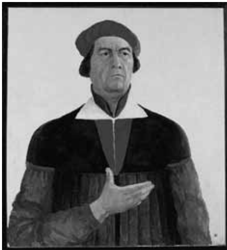
Kazimir Malevich, Zelfportret , 1933

Malevich doorliep verschillende stilistische fases: het symbolisme, het impressionisme, het kubisme en het suprematisme worden door een aantal sleutelen werken belicht. Hoogtepunt van de inleidende serie werken is het volledig abstracte werk Het Zwarte Vierkant (1913), dat als een van de bekendste werken uit de kunstgeschiedenis geldt. Vervolgens wordt