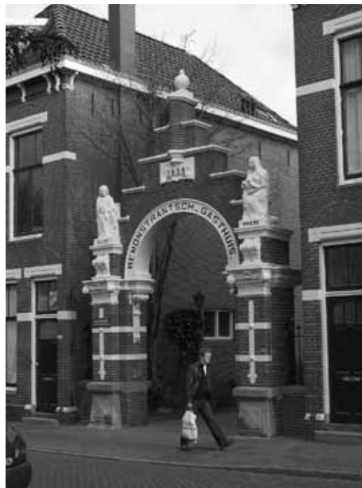
Beeld op de poort van het Remonstrants Gasthuis, Noorderbinnensingel, Groningen