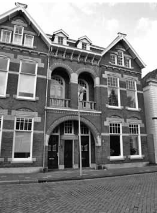
Dubbel woonhuis, Meppel Zuideinde 60-62, 1906