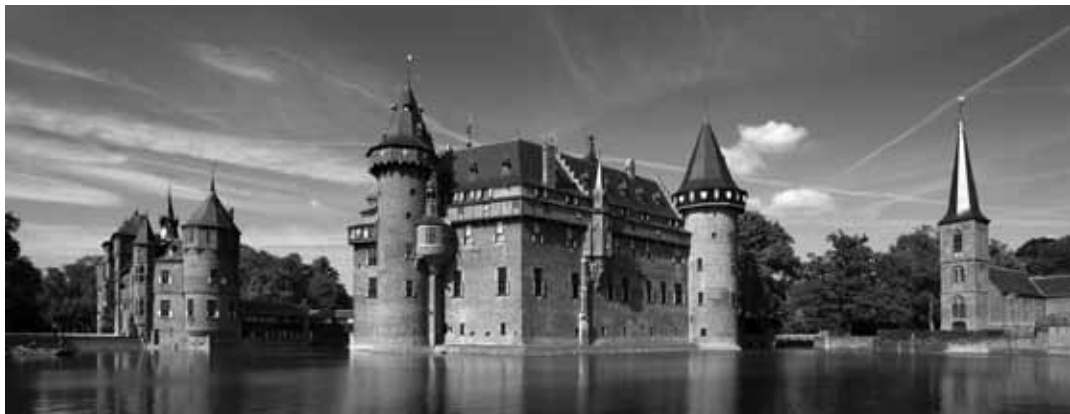
Kasteel De Haar, Haarzuilens