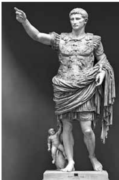
Augustus van Prima Porta, 1ste eeuw, Vaticaan Museum

Augustus was de eerste 'princeps' en bracht Rome rust en orde na een eeuw van burgeroorlogen. Maar ook een nieuw systeem van erfopvolging deed zijn intrede: het principaat ofwel de Romeinse keizertijd. Augustus beroemde zich erop dat hij "een stad van baksteen had aangetroffen en een stad van marmer naliet". Na een succesvolle campagne in Spanje en Gallië liet Augustus bijvoorbeeld zijn 'Vredesaltaar', de Ara Pacis in Rome bouwen.