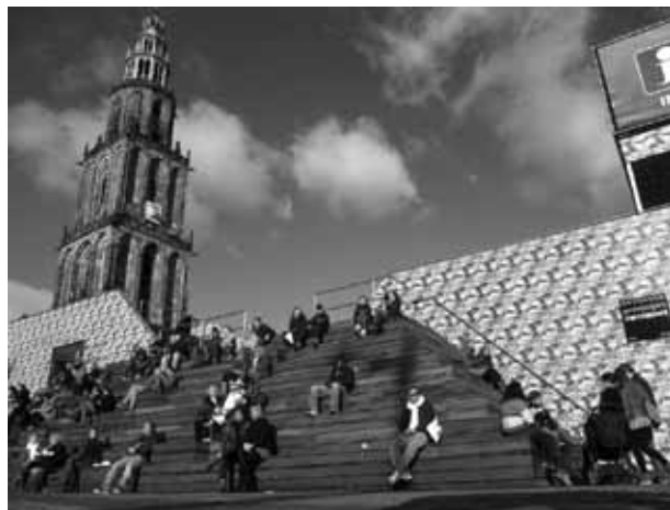
Tijdelijke onderkomen van de VVV op de Grote Markt, Groningen

Onder de bezielende leiding van wethouder Ypke Gietema vond in 1987 de opstart plaats van het spraakmakende project "Binnenstad Beter". Het project was het plan voor de aanpak van de Groningse binnenstad. Ruimtes moesten opnieuw worden opgekrikt of opnieuw ingericht, auto's moesten nog meer worden geweerd... er werd een hele waslijst van eisen en wensen opgesteld. "Binnenstad Beter", wat is er sinds 1987 eigenlijk gebeurd?