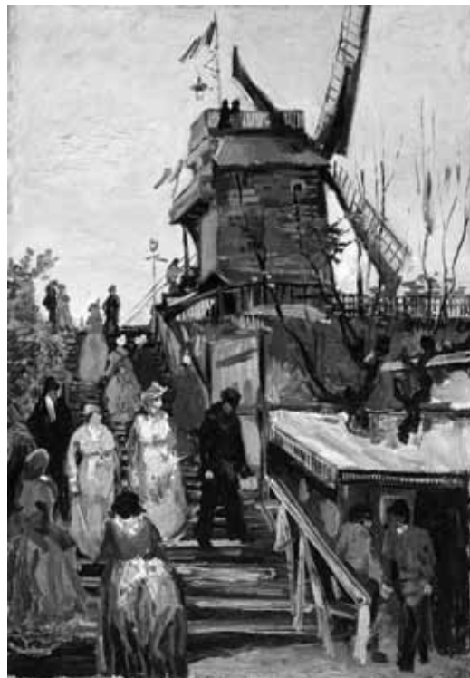
Vincent van Gogh, Windmolen Le Blute-fin, 1886

De café's rijzen als paddenstoelen uit de grond. Daar vinden we de vele prostituees, absintverslaafden, syfilislijders, schilders en fotografen. Tussendoor