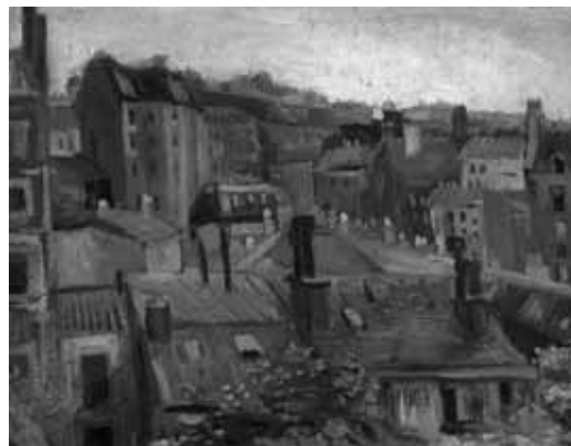
Vincent van Gogh, Gezicht vanuit Vincents atelier 1886 , Van Gogh Museum, Amsterdam

In het voetspoor van Van Gogh volgden kunstenaars als Kees van Dongen, Jan Sluijters en Leo Gestel, die via het fauvisme van Matisse de Nederlandse schilderkunst verrijkten met hun expressieve kleuren. Piet Mondriaan kwam in Parijs in aanraking met het