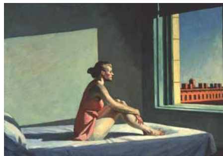
Edward Hopper (1882-1967), Ochtendzon, 1952, olieverf op doek, 71,44 x 101,93 cm, Columbus Museum of Art, Ohio

De tentoonstelling The American Dream in Assen en Emden presenteert Amerikaanse realistische kunst van na de Tweede Wereldoorlog tot heden. Topkunstenaars als Edward Hopper, Andrew Wyeth, Roy Lichtenstein, Andy Warhol, Alice Neel, Richard Diebenkorn, Martha Rosler, Alex Katz en Chuck Close tonen de 'American Way of life' in alle verschijningsvormen.