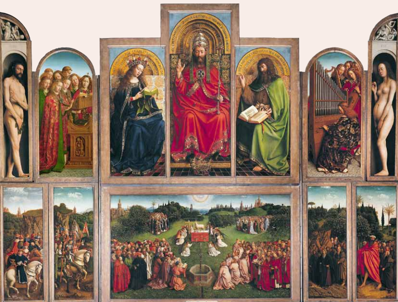
Jan van Eyck (Maaseik circa 1390 - Gent 1441) en Hubert van Eyck (Maaseik circa 1366 - Gent 1426), Het Lam Gods , 1432, olieverf op paneel, 340 x 440 cm, Gent, Sint-Baafs Kathedraal