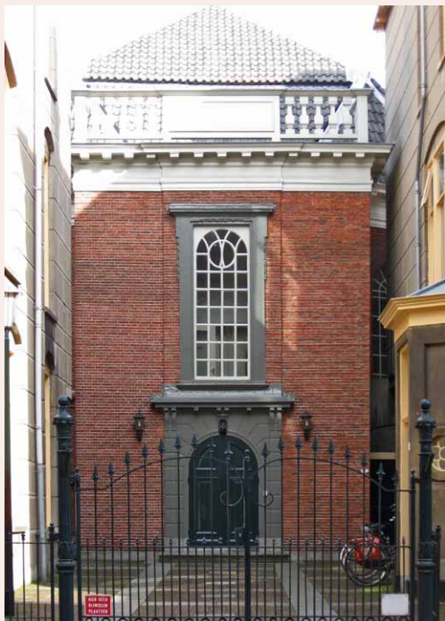
Doopsgezinde Kerk, Groningen