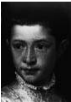
Tiziano, Ranuccio Farnese, rond 1542

In deze lezing onderzoeken we functies en betekenissen van portretten in de vijftiende en zestiende eeuw. In die tijd maakte het portret een bloeiperiode door als zelfstandig genre in de beeldende kunst. Het klassieke denkbeeld dat de mens middelpunt is van de wereld, leefde sterk op. Het is dan ook pas