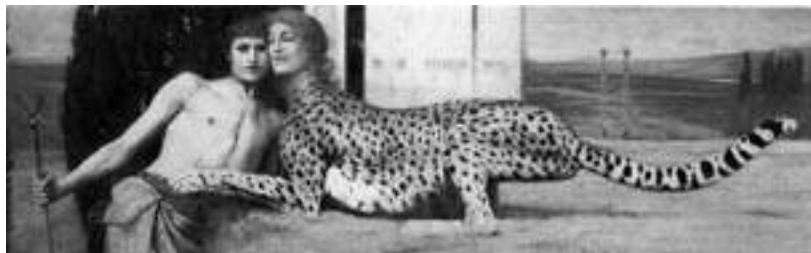
Fernand Khnopff, De sfinx, 1896

kunst waren Gustave Moreau, Odilon Redon en Paul Gauguin.