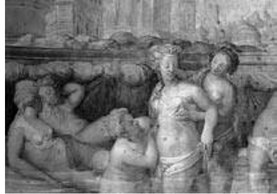
Francesco Salviati, David en Bathseba, 1554, Palazzo Sacchetti, Rome

In deze lezing zullen dergelijke vragen besproken worden aan de hand van dia's van de schilderijen in