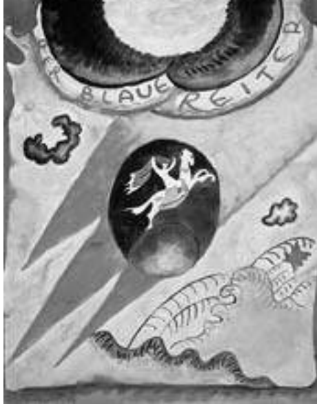
Wassily Kandinsky, Ontwerp voor de omslag van de Almanak, 1911 , Lenbachhaus München

deze expositie waren Franz Marc, Wassily Kandinsky en Gabriele Münter, zijn vrouw. Zij keerden daarmee de bestaande kunstenaarsvereniging, Der Neue Künstlerverein, de rug toe. Daar werd Kandinsky's stap naar abstractie niet geaccepteerd. Der Blaue Reiter werd een informele groep van getalenteerde kunstenaars die geen duidelijke theorie hadden, maar wel enkele gemeenschappelijke ideeën. Ze wilden de geestelijke wereld onder de materiële en zichtbare oppervlakte zichtbaar