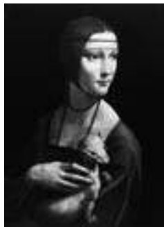
Leonardo da Vinci, Cecilia Gallerani, rond 1484

in deze periode dat 'portret' de betekenis krijgt van een kunstwerk waarin een mens is afgebeeld - een individuele, gelijkende weergave van één of meerdere personen.