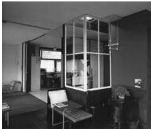
Gerrit Rietveld, Interieur Rietveld-Schröderhuis, Utrecht, 1924