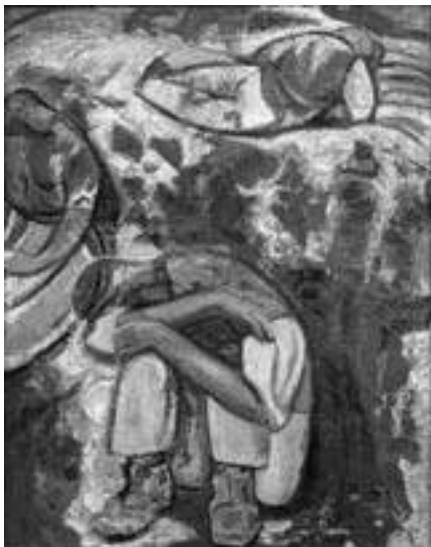
Constant Permeke, Slapende maaiers in de zon, 1917

Het Vlaamse expressionisme ontstond voor een belangrijk deel in Amsterdam, toen bij het begin van de Eerste Wereldoorlog een miljoen Belgische vluchtelingen uitwaken naar het neutrale Nederland. Zo kwamen de schilders Gustave de Smet en Frits van den Berghe terecht in de kringen van de Bergens-Amsterdamse kunstenaars die zich tot het expressionisme wendden. De Belgen kwamen in hun landschappen en figuurstukken tot een persoonlijke variant, die zich kenmerkt door robuuste, sterk vereenvoudigde vormen. Vergeleken met hun Nederlandse collega's zijn zij in hun expressie minder gematigd. In 1922 terug in Vlaanderen kwamen zij met een meer harmonieus expressionisme tot volle bloei. De derde, meest radicale, en ook meest intuïtieve Vlaamse expressionist is Constant Permeke. Hij