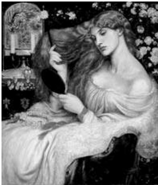
Dante Gabriel Rossetti, Lady Lilith, 1868

Dante Gabriel Rossetti (1828-1882) was een van de oprichters van de zogenaamde Pre-Raphaelite Brotherhood. Deze kunstenaarsgroep zwoer alle aangeleerde academische regels af en pleitte voor een terugkeer naar de natuur. Rossetti's werk is vooral bekend geworden door