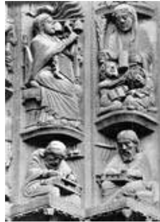
Portaal kathedraal van Chartres

Mettertijd verschuift ook de iconografie. In de eenvoudigste uitvoering is het vooral de thematiek van Christus in Majesteit, standaard gecombineerd met