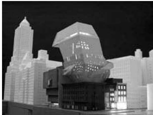
Rem Koolhaas, Whitney museum