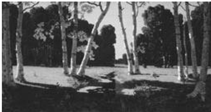
Archip Koeïndzji. Het berkenbos , 1879