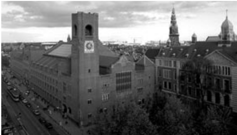
H.P. Berlage, Beurs, Amsterdam, 1903