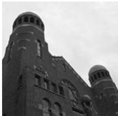
Synagoge, Folkingestraat, Groningen