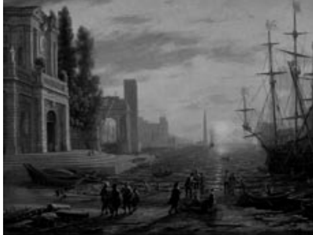
Claude Lorrain, Een haven , 1639

Italië is eeuwenlang voor noorderlingen het land van hun dromen geweest. Dit zonnige aantrekkelijke land met zijn rijke cultuur en vele kunstuitingen was een onuitputtelijke bron van inspiratie voor menig kunstenaar. We volgen de ontwikkeling van eeuw tot eeuw en zien hoe de belangstelling telkens een nuance verschuift. Tot het eind van de 18de eeuw beelden schilders steeds dezelfde plekken uit. Buiten