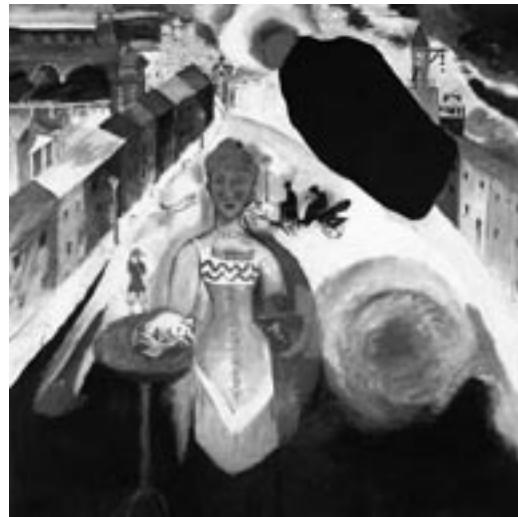
Wassily Kandinsky, Dame in Moskou, 1912