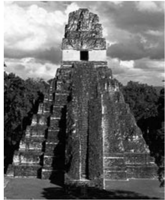
Piramide van Tikal

Tijdens deze lezing zullen onder meer de volgende vragen over de Maya's worden besproken. Hoe heeft deze Midden-Amerikaanse cultuur zich ontwikkeld? Hoe zagen de Maya-steden eruit? Hoe zagen de Maya's de goddelijke wereld om hen heen? Waarom vreesden de Indianen voor het einde van de