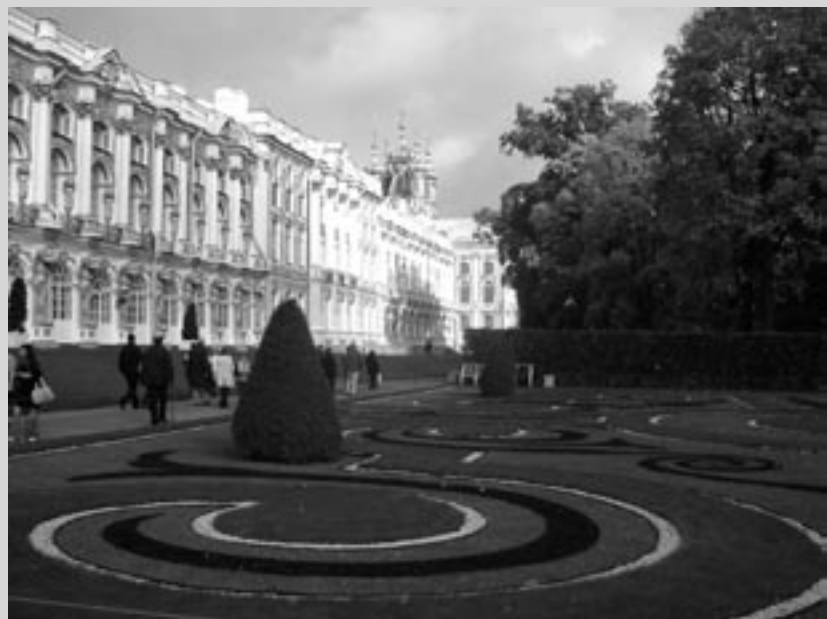
Excursie naar St. Petersburg, september 2005