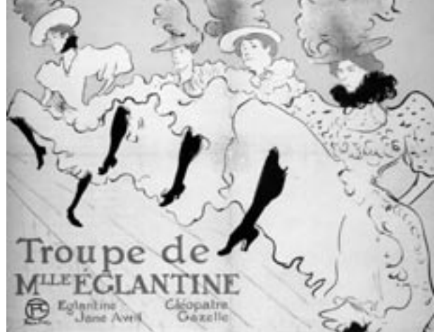
Henry de Toulouse-Lautrec, Troupe de Mlle. Eglantine, 1895-1896

Toulouse-Lautrecs carrière als kunstenaar start tien jaar later dan die van de meeste impressionisten. In 1882 trekt de kunstenaar, die was geboren in een adellijke familie in Zuid-Frankrijk, naar Parijs en stort zich op de schilderkunst. Hij brengt veel tijd door op Montmartre en dat zien we terug in de onderwerpen van zijn werk: de café's, de bordelen, de theaters en het cabaret. Maar ook de renbanen aan de rand van Parijs en het circus komen voor. In 1887 maakt Lautrec kennis met Vincent van Gogh.