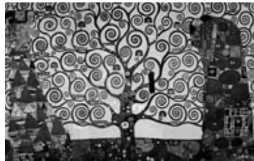
Gustav Klimt, Fries in Palais Stoclet, Brussel, circa 1910

Carolien ten Bruggencate is kunsthistoricus en heeft zich gespecialiseerd in de kunstgeschiedenis van de 19de en 20ste eeuw.