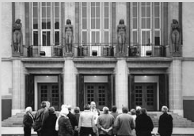
Kunst in Zicht bij het Stadttheater in Hagen, 12 november 2005