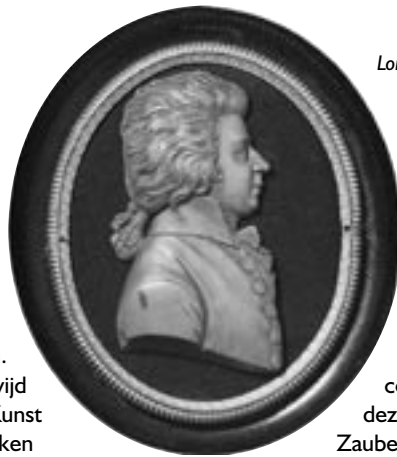
Lorenzo Posch, Medaillon van Mozart, 1789

Kunst en muziek worden in de tijd van de barok nog vaak in opdracht van de kerk gemaakt. De kerkmuziek die Mozart in Salzburg heeft geschreven bevat nog veel elementen uit deze stijlperiode. In de 18de eeuw komen er echter reacties op de plechtstatigheid van de barok en treden andere stromingen op de voorgrond. In de beeldende en decoratieve kunst vinden we de rococo, en in de 'pre-klasseieke' muziek doen de 'Sturm und Drang' en de galante stijl hun intrede. Speelsheid, elegantie, lieflijkheid en luchthartige frivoliteit zijn de trefwoorden.