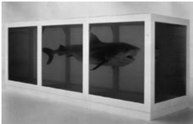
Damien Hirst, The Physical Impossibility of Death in the Mind of Something Living, 1991