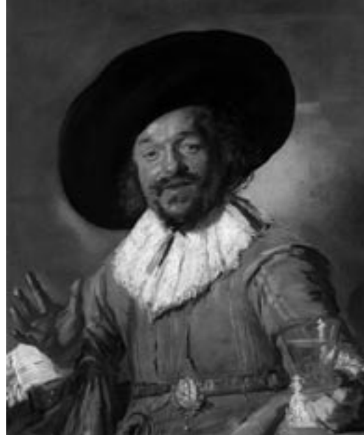
Frans Hals, De vrolijke drinker , circa 1628-1630