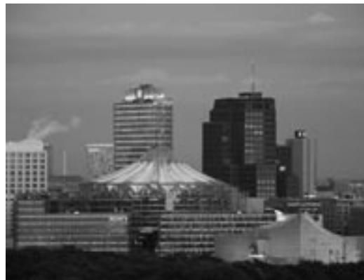
De nieuwe skyline van Berlijn.

Nieuwe musea verrezen, bestaande musea ondergingen grondige opknappbeurten en ingrijpende herschikkingen van kunstcollecties vonden plaats. In Berlijn-Mitte vinden we een prachtig ensemble van 19de- en begin 20ste-eeuwse museumarchitectuur op het zogenaamde Museumsinsel, waar de restauratiewerkzaamheden nog voortduren tot 2010. De Alte Nationalgalerie, een schoolvoorbeeld van een 19de-eeuwse museumtempel, opende echter in 2001 al